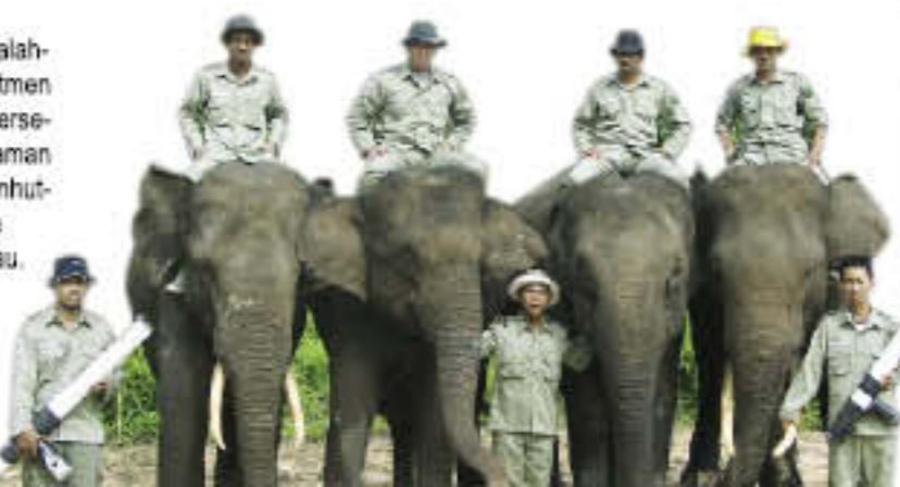
Keterangan foto: Tim Flying Squad Taman Nasional Tesso Nilo

WWF Indonesia - Program Riau bekerjasama dengan Balai Konservasi Sumber Daya Alam Riau telah berupaya mengurangi KMG di lapangan khususnya di Tesso Nilo dengan menerapkan beberapa tehnik, salah satunya dikenal dengan nama "Flying Squad".