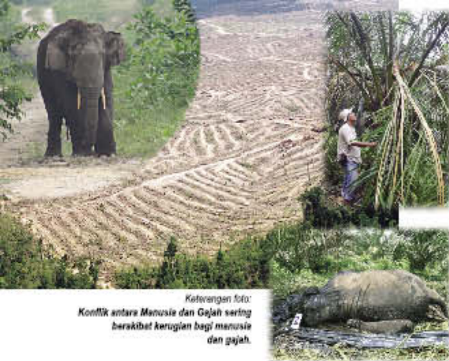
Keterangan foto: Konflik antara Manusia dan Gajah sering berakibat kerugian bagi manusia dan gajah.