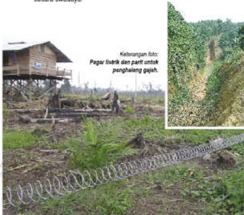
Keterangan foto: Pagar listrik dan parit untuk menghalangi gajah.